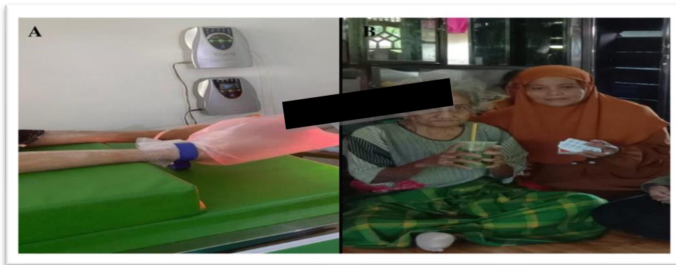
Gambar 2: A. Pengaplikasian Terapi Ozon, B. Pengaplikasian Terapi Nutrisi

Pengaplikasian terapi ozon dan nutrisi dapat dilihat pada gambar 2