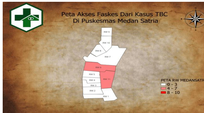
Gambar 4. Olah Data Peta Akses Menggunakan QGIS

Total fasilitas kesehatan yang ada di Puskesmas Medan satria ialah 17 faskes. Berdasarkan peta akses fasilitas kesehatan (faskes) di wilayah kerja UPTD Puskesmas Medan Satria, terlihat distribusi yang tidak merata antar RW.