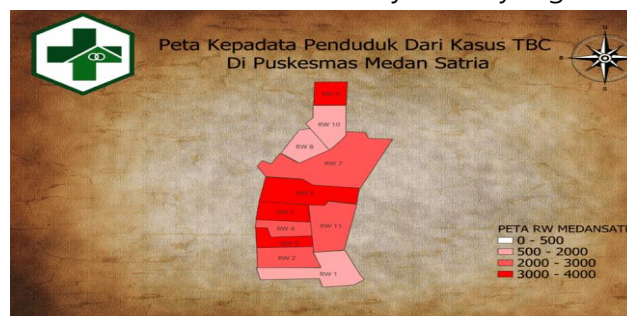
Gambar 2. Olah Data Peta Kepadatan Penduduk Menggunakan QGIS

Kepadatan penduduk merupakan salah satu faktor lingkungan yang berperan penting dalam penularan penyakit menular, termasuk Tuberkulosis (TBC). Di wilayah kerja UPTD Puskesmas Medan Satria, tingkat kepadatan hunian yang tinggi berpotensi meningkatkan risiko penularan TBC, terutama di area dengan ventilasi buruk dan interaksi antarindividu yang intens. Oleh karena itu, analisis sebaran kasus TBC berdasarkan tingkat kepadatan penduduk menjadi penting untuk mengidentifikasi wilayah-wilayah dengan risiko tinggi dan sebagai dasar perencanaan intervensi kesehatan masyarakat yang lebih efektif.