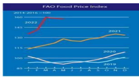
Gambar 1. FAO Food Price Index

Krisis pangan merupakan keadaan yang berbahaya dan tidak stabil, yang timbul akibat situasi kritis, serta berkaitan dengan sumber daya hayati baik yang telah diolah maupun yang tidak diolah, untuk kebutuhan makanan dan minuman manusia (Ita Aryulia et al., 2022). Tantangan dalam sektor pangan seringkali dimulai dari tingginya harga pangan di pasar. Peningkatan harga pangan secara global berdampak pada pola konsumsi makanan di negara-negara berkembang. Kenaikan harga komoditas, terutama energi dan pangan, menyebabkan inflasi di dalam negeri (Larasati, 2022), dan pengurangan opsi pangan meningkatkan risiko kelebihan pangan.